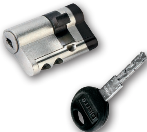
Chiave standard Standard key